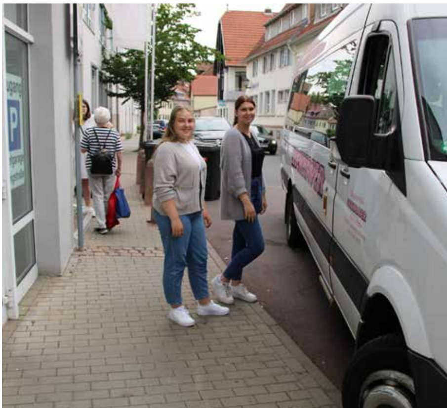
Wartebereich an der Bushaltestelle vor der Volksbank Main-Tauber e G