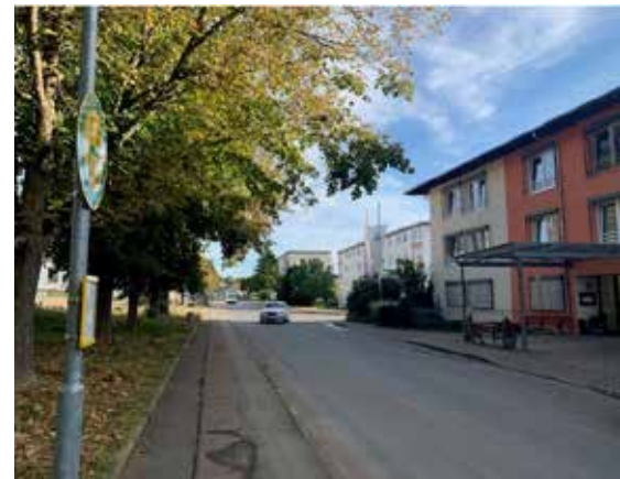
Für Besucher und Bewohner des Haus Heimbergs oder des Johannes-Sichart-Hauses wurde nun die Haltestelle „Johannes-Sichart-Haus“ wiederhergestellt.

Der Tauberbischofsheimer Stadtbus trägt dazu bei, die Mobilität der Bürger*innen zu verbessern und bietet eine umweltfreundliche Alternative zum Individualverkehr. Die Stadtverwaltung bedankt sich bei der Firma Bustouristik Eisenhauer für ihren zuverlässigen Betrieb der Stadtbuslinie und wird sich weiterhin für eine gute Verkehrsanbindung in Tauberbischofsheim einsetzen.